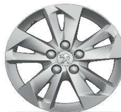
jante aliaj 16" TARANAKI