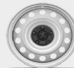
jante tabla 16"