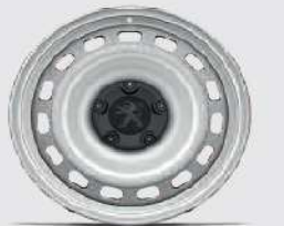
jante tabla 15"