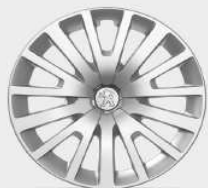
capace 15" Milford