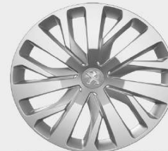
capace 16" Rakiura